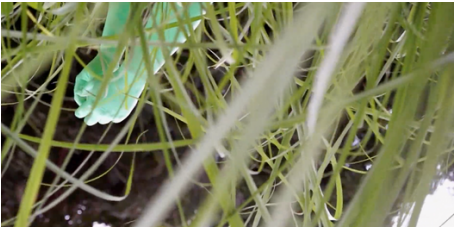
Momo Magalión - Panamá

cómo el poder económico contamina y degrada el entorno, afectando sobre todo a las comunidades más vulnerables.