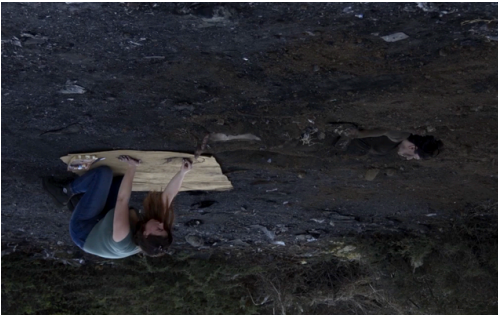
La Poza (2014)

Intervención que transgrede el espacio, liberando al peatón y generando el derecho a un espacio compartido. Le permite acceder libremente a las diferentes dinámicas del centro y a los edificios emblemáticos del Centro Histórico, recordando que se trata de personas de la población general, quienes deben tener acceso y derecho a la transparencia y al conocimiento para generar reflexiones sobre nuestro propio contexto y realidad. Permitir al peatón/a repensar su propia condición de ciudadano/a como parte de la dinámica de la sociedad.